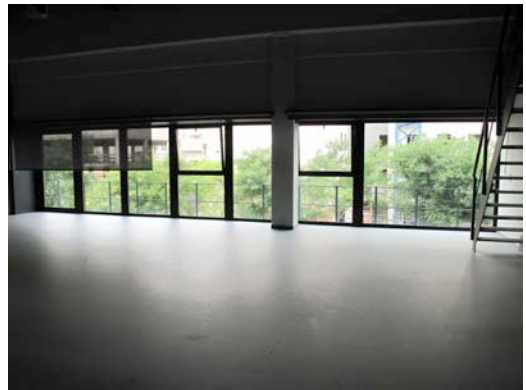
Sala Mitjana (90 m2)

Si vols conèixer els espais del Graner, contacta abans del 5 d'agost per concertar una visita.