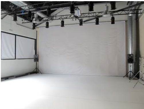
Sala Mitjana amb Tècnica (90 m2)