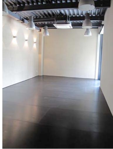
Sala Petita (35m2)