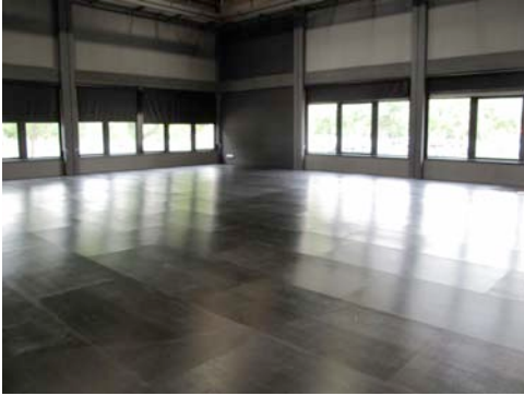
Sala Gran (240 m2)